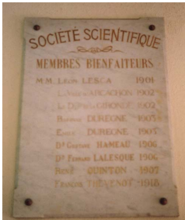
Plaque de l'entrée du Musée-Aquarium d'Arcachon

Avant que cette plaque ne tombe sous le coup des démolisseurs, nous pouvons prendre la peine de nous intéresser plus en détail à cet illustre personnage.