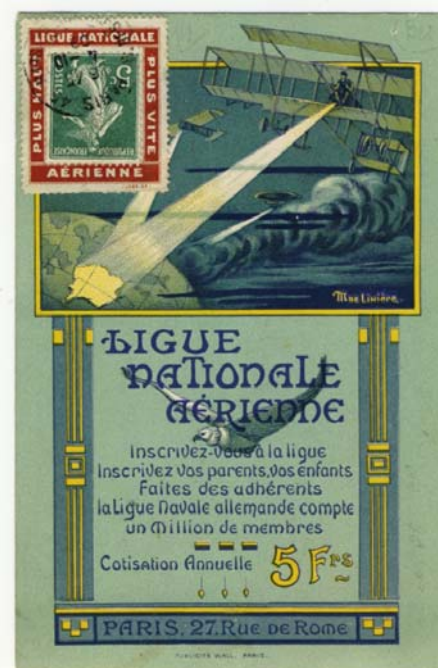
Carte postale de la Ligue Nationale Aérienne