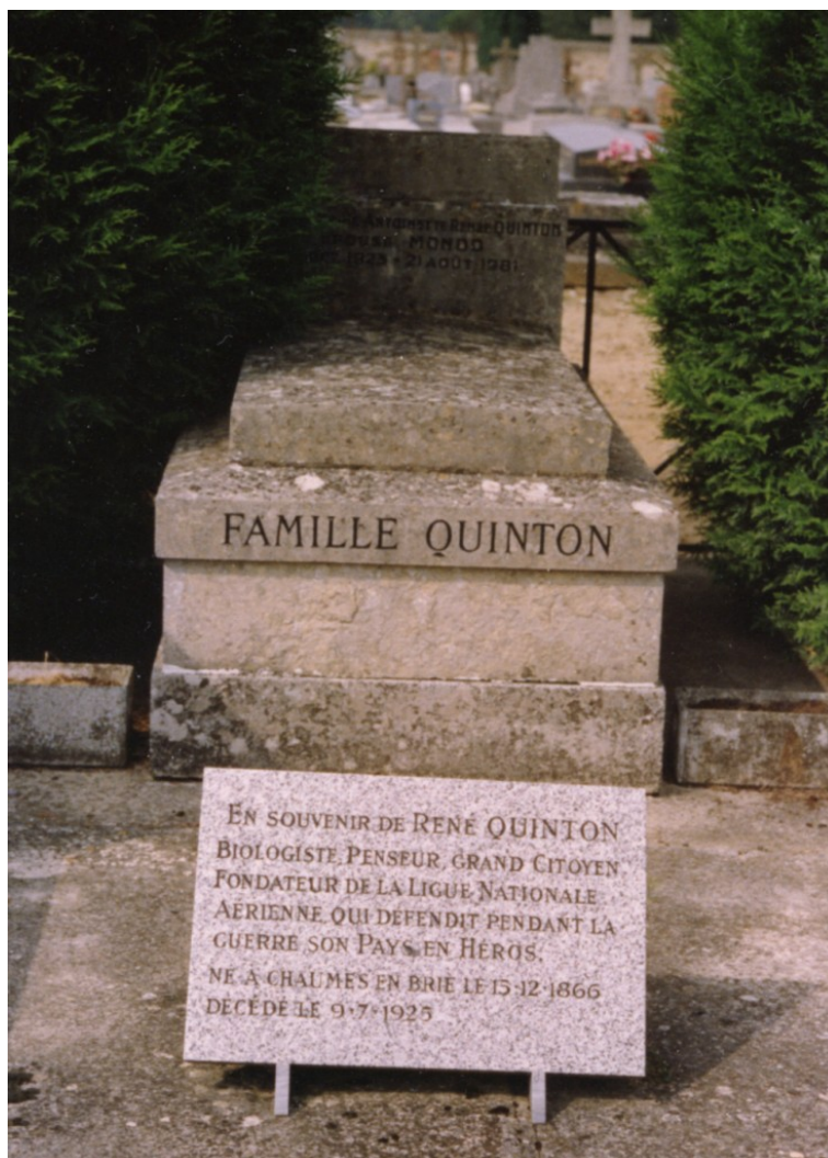
Tombe de la famille Quinton à Chaumes-en-Brie